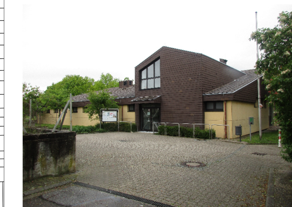
Mehrzweckhalle im Westen Büchelbergs