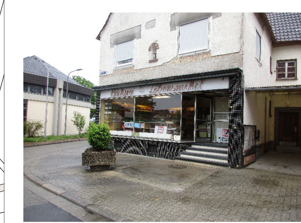
Bäckerei in der Ortsmitte