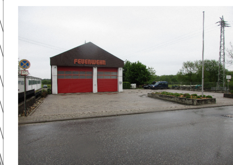
Feuerwehr im Süden Büchelbergs