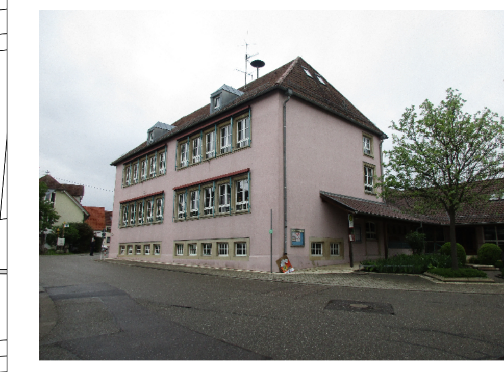
Grundschule und Jugendzentrum