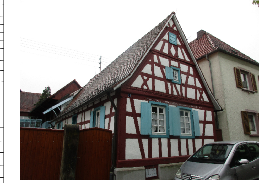
Heimatverein Laurentius Hof im Dorfkern